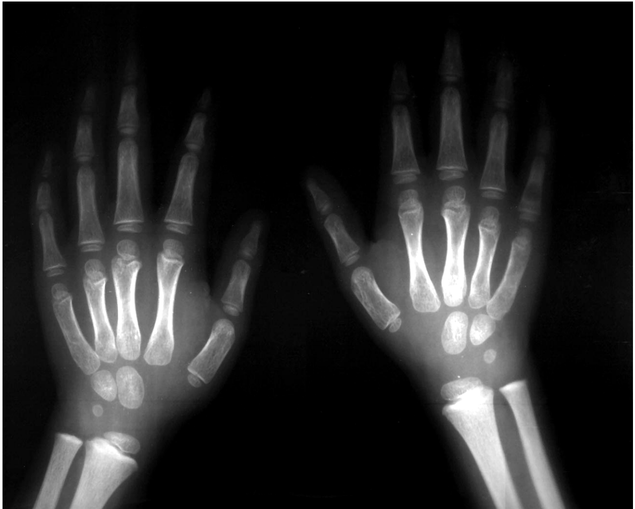
Figura 2. Radiografías de huesos largos en las manos

"Líneas de plomo" presentes en un niño de 5 años con retraso en el crecimiento radiológico y con un nivel de plomo de 37.7 \mu\text{g}/\text{dL} .